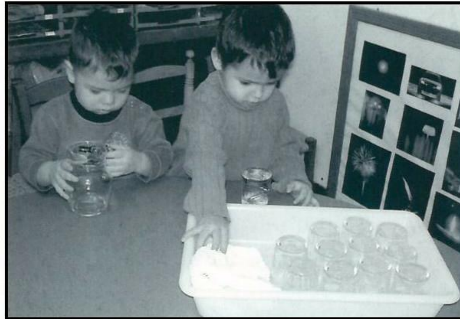
¿Demasiada agua? Grande, pequeño, lleno, vacío...